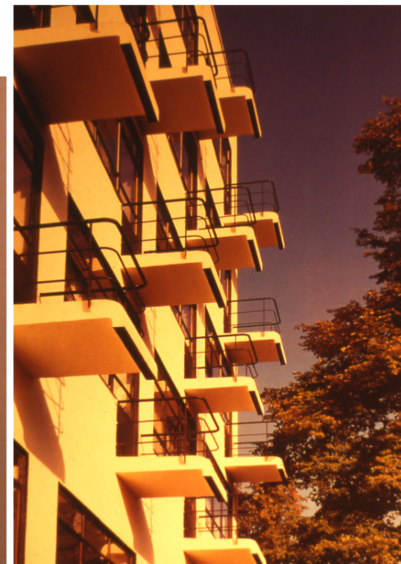
1 Vista detalles balcones en donde se ve la composición diagonal de planos en el aire.