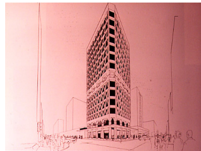
3 Isométrica del proyecto del concurso (no construido) la concepción de la cruceta estructural, llevada a la fachada.