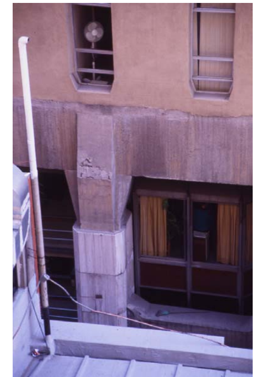
6 Detalle de apoyo cinturón – pilar.