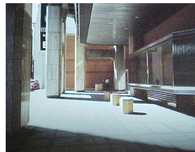
5 Retranqueo del primer nivel, para dar paso a los pilares que descargan las fuerzas del tejido estructural, generando espacio de circulación previo al acceso.