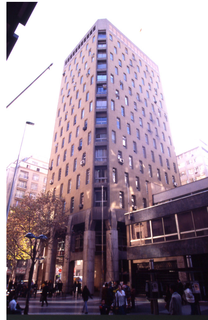
4 Tejido estructural y descarga de fuerzas en sobre el cinturón el cual es sostenido por los pilares.