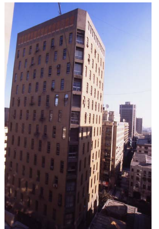
7 Producto de la modificación del concurso las cuatro fachadas quedaron iguales, sin responder al contexto v al clima.